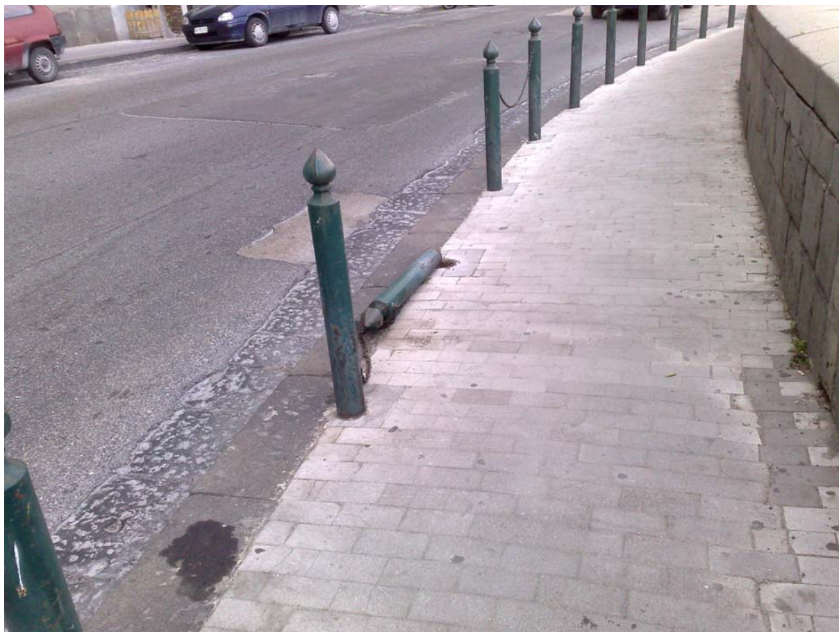
Via Posillipo, tratto in conglomerato bituminoso e mattonelle in asfalto