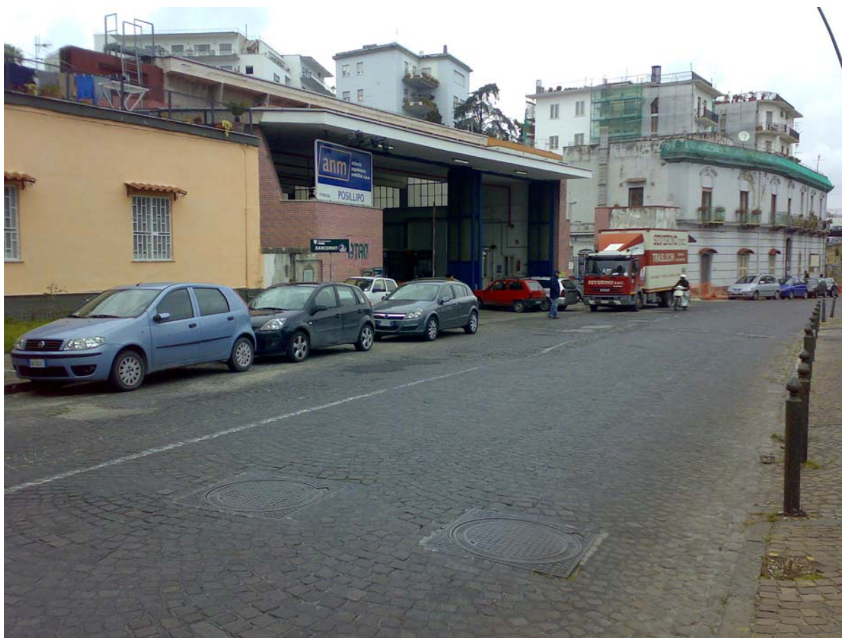
via Posillipo, deposito ANM