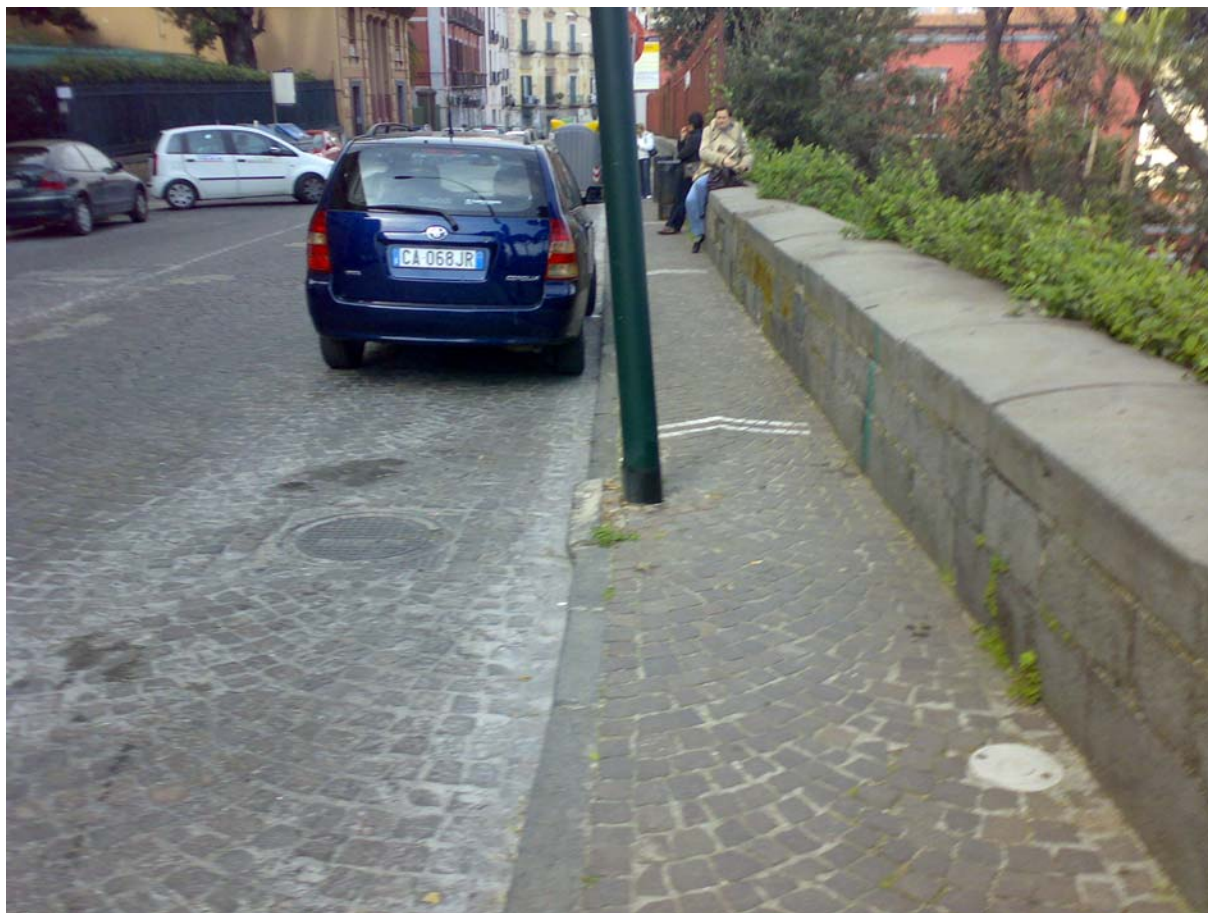
via Posillipo, tratto in cubetti di porfido